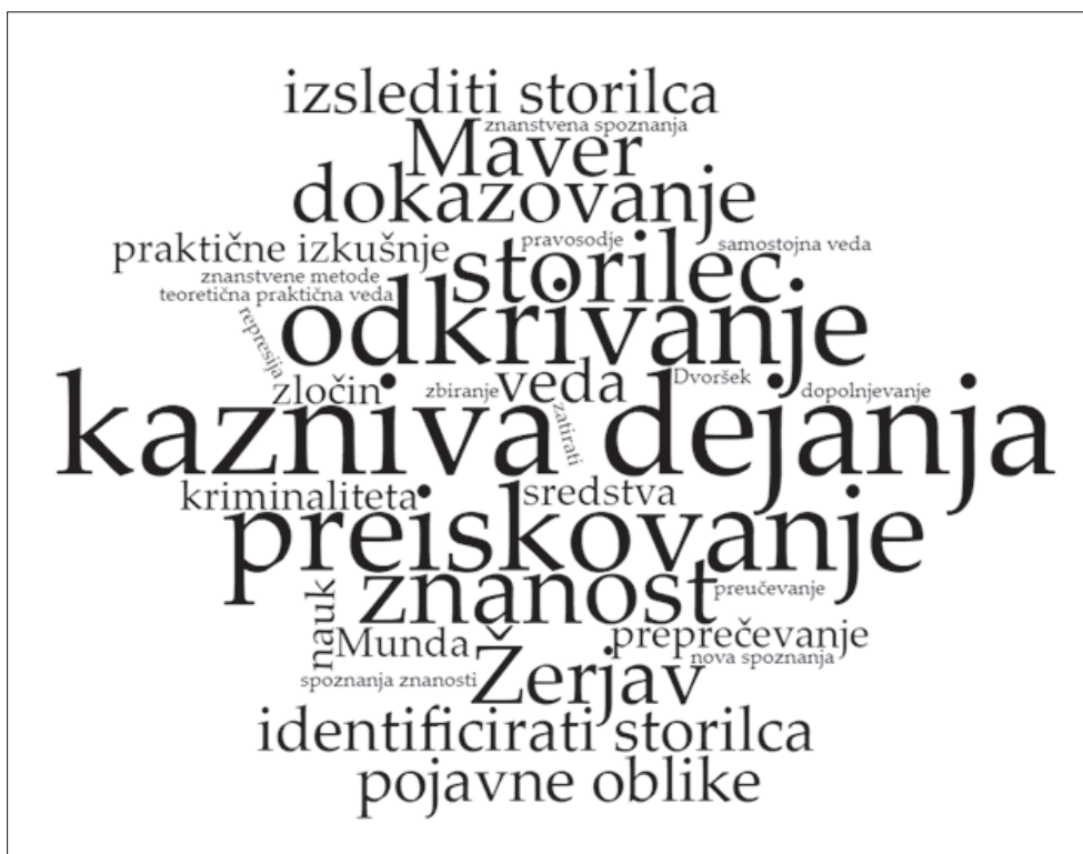
Slika 1: Oblak uporabljenih besed v opredelitvah kriminalistike

S pomočjo orodja za analizo besedilnih zbirk WordClouds.com (Zygomatic, 2003) dobimo sliko najpogosteje uporabljenih besed in besednih zvez, iz katere so razvidne ključne besede na tem področju. To so: kazniva dejanja, odkrivanje, preiskovanje, znanost, storilec, Maver, Žerjav, dokazovanje, identificirati storilca, izslediti storilca, pojavne oblike, veda, preprečevanje, Munda, nauk, kriminaliteta, praktične izkušnje, sredstva in zločin (slika 1). Če iz besed na sliki 1 izločimo priimke avtorjev (Maver, Žerjav, Munda) in besede, ki jih v sodobnem času v strokovnem jeziku ne uporabljamo (zločin), dobimo naslednje besede: kazniva dejanja, odkrivanje, preiskovanje, znanost, storilec, dokazovanje, identificirati storilca, izslediti storilca, pojavne oblike, veda, preprečevanje, nauk, kriminaliteta, praktične izkušnje in sredstva.